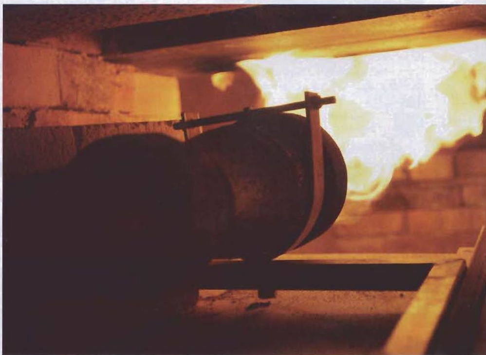
Chauffage direct des cuves de brassage chez Dupont.

Comme Tom voulait nous faire goûter tout ce qu'il a sur sa carte des bières, il nous a encore régalez de scampi aux